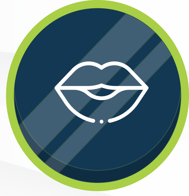
DIMENSIÓN COMUNICATIVA (LENGUAJE E INGLÉS)