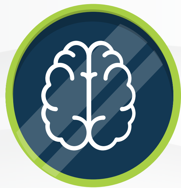
DIMENSIÓN COGNITIVA (MATEMÁTICAS)